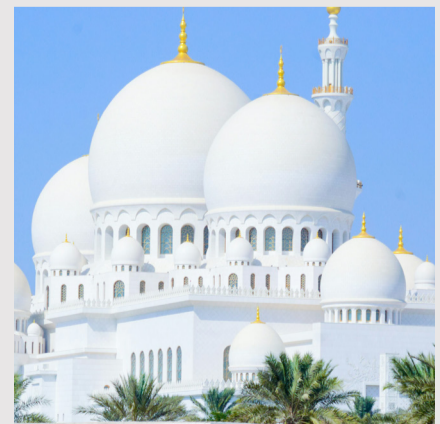
Gran mezquita de Dubái