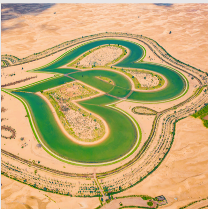
Al Qudra Lakes